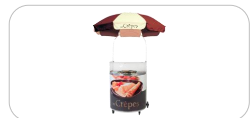
Chariots à crêpes / crepe carts