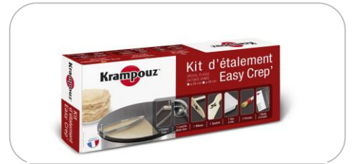
Kit d'étalement / kit spreader